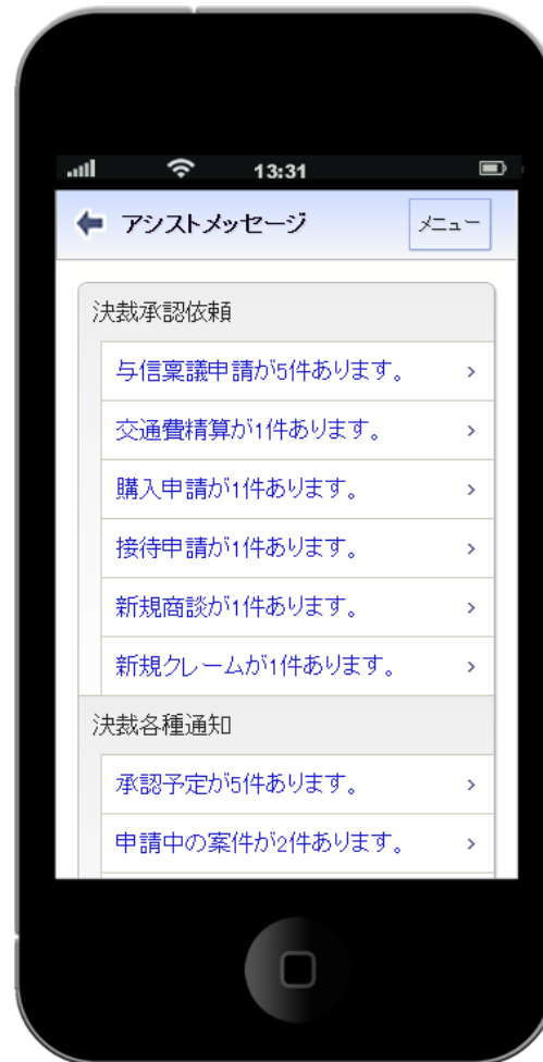
アシストメッセージ