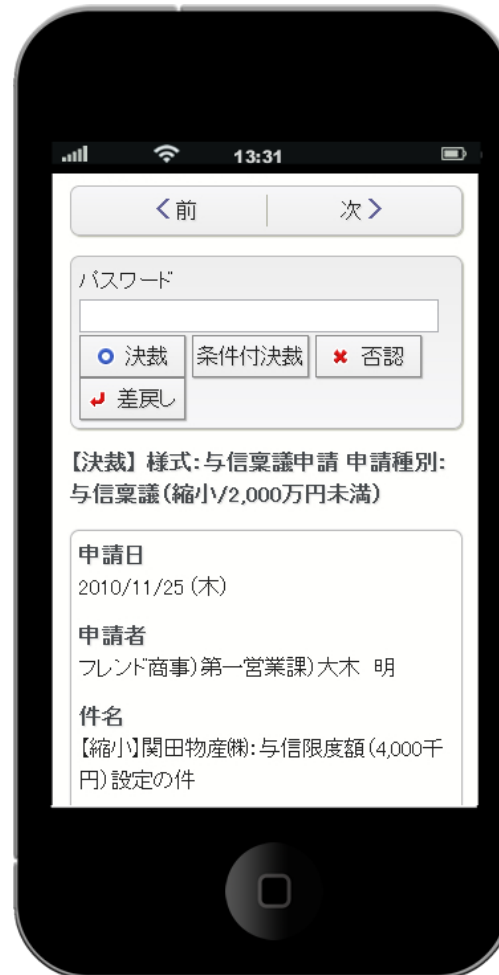
内容表示 (審議・決裁)