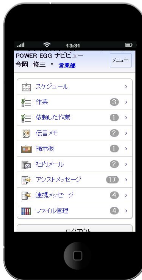
ポータル画面 (リスト)