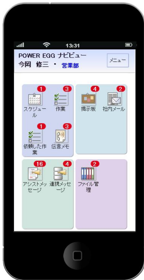
ポータル画面 (4分割)